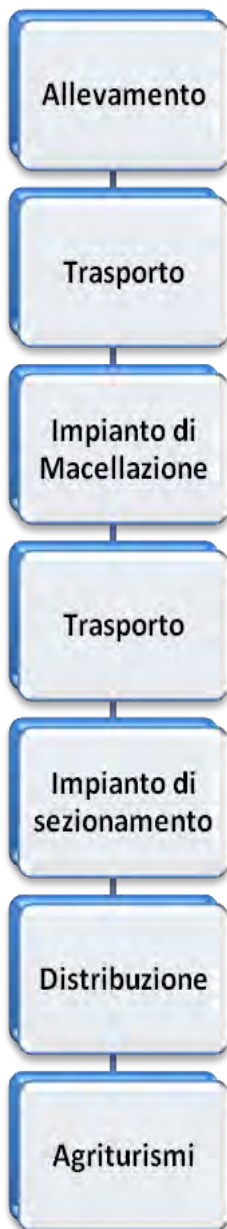
DIAGRAMMA DI FLUSSO